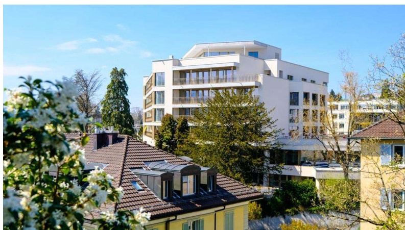
Viva Luzern betreibt bereits heute Alterswohnungen im Dreilinden, zum Beispiel im Haus Pilatus.

Die Stadt Luzern will Viva Luzern und Spitex Stadt Luzern in eine integrierte Organisation zusammenführen. Nun beschreibt der Stadtrat die mögliche Rechtsform – und zeigt die nächsten Schritte. Auch wird klar, was mit den 210 städtischen Alterswohnungen passieren soll.