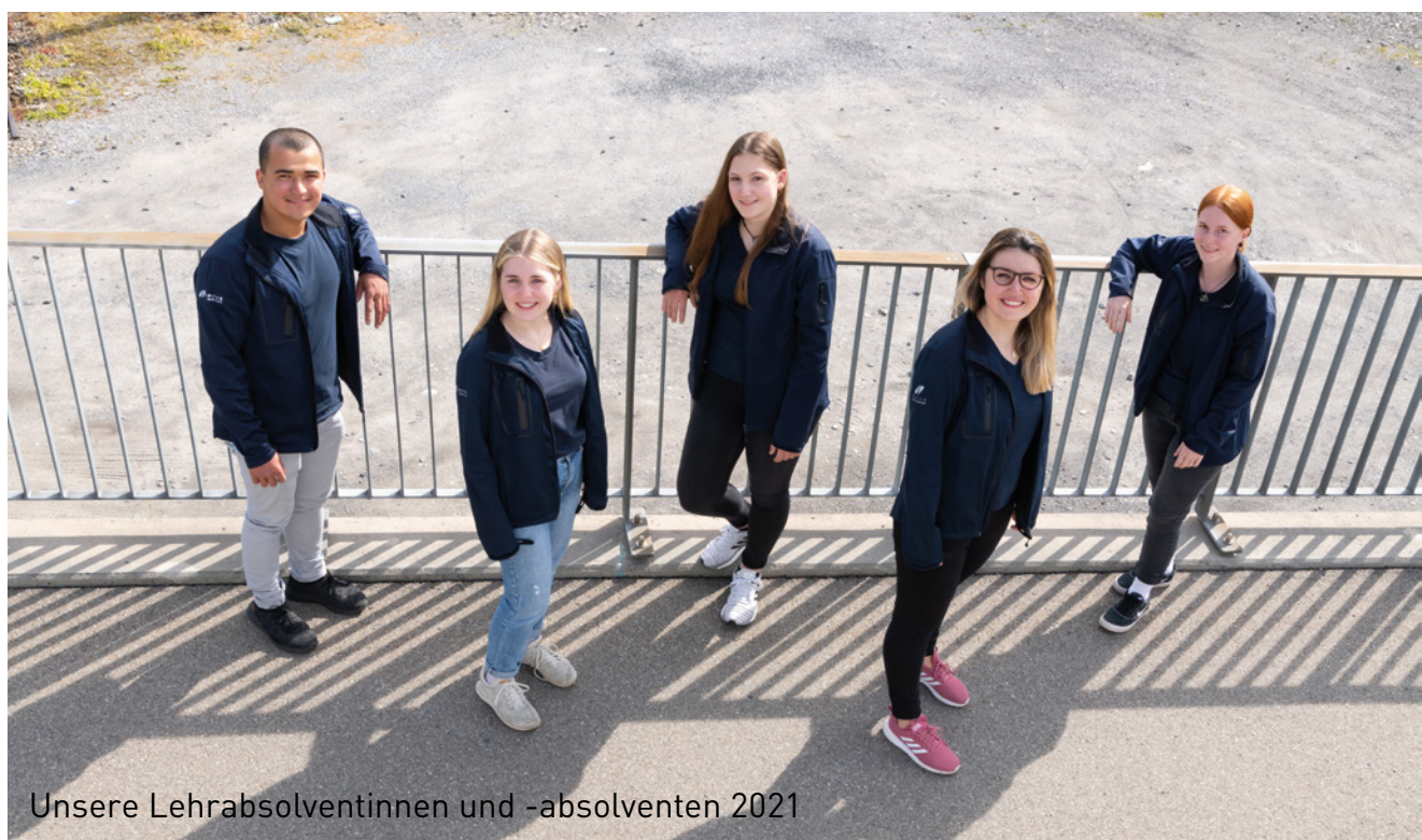
Unsere Lehrabsolventinnen und -absolventen 2021

Die Darstellung in den einzelnen Positionen der Jahresrechnung erfolgt in ganzen Franken, daher können Rundungsdifferenzen entstehen.