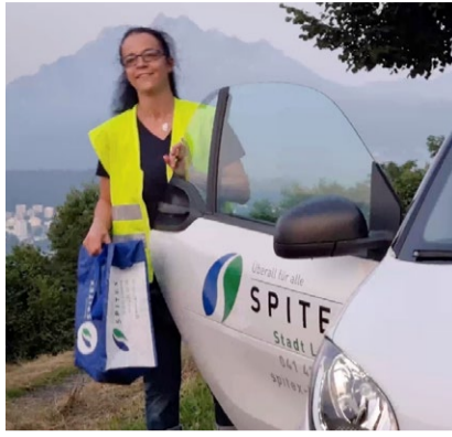
Die Spitex ist angewiesen auf motiviertes und ausgebildetes Personal.

Der Fachkräftemangel in der Pflege ist nicht erst seit der Corona-Pandemie ein Thema. Spitex-Organisationen stellen dies vor eine doppelte Herausforderung: Auf der einen Seite wird die Gesellschaft immer älter und immer mehr Menschen wollen auch bei gesundheitlichen Einschränkungen zu Hause gepflegt und betreut werden – hierfür braucht es künftig deutlich mehr