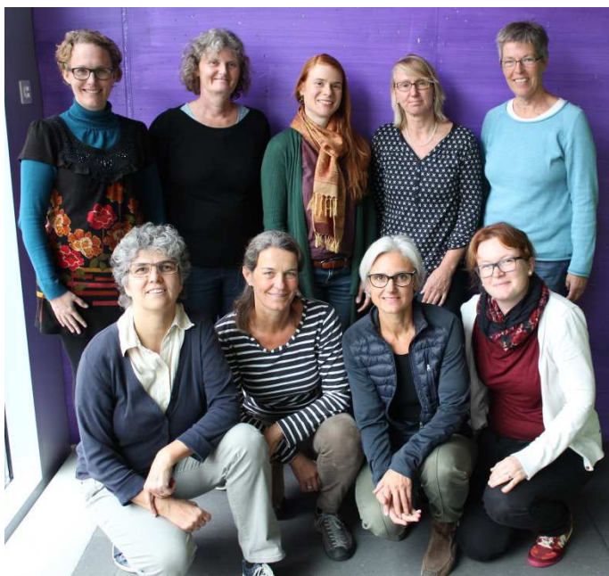
Ein starkes Team: Mitarbeitende des Brückendienstes Spitex Stadt Luzern

13.30 Uhr: Frau Egolf hat den nächsten Einsatz von Bea N. selbst übernommen. Einmal pro Woche ist der Brückendienst bei Frau P., einer jungen Frau mit Bronchus-Karzinom. Sie ist nach einer OP und Chemotherapie aus dem Spital zurück. Oft hat sie Angst zu ersticken; da sie allein lebt, ist sie froh um die Gespräche mit den Pflegefachfrauen. Frau E. geht auf ihre Bedürfnisse ein: Treten bestimmte Symptome verstärkt auf? Ist eine Symptomkontrolle in Zusammenhang mit den Ängsten erforderlich? Braucht die Klientin psychologische Unterstützung? Kann mit geeigneter Lektüre weitergeholfen werden?